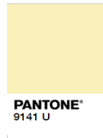
Rejected (Too Light)