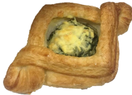
ลักษณะรูปทรงปกติ