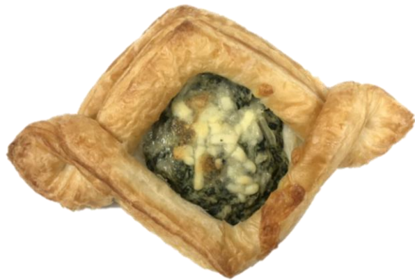
ขอบข้างของครีวของค์เหลื่อมกัน/สัมผัสแต่อยู่ในสเปคที่กำหนดและไม่เป็นรู