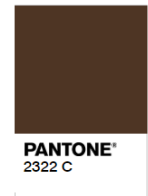
Rejected (Too Dark)